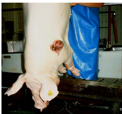
So med grad 4 skuldarsår på slagtegangen.